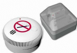
CDA-707R autonomní + externí signalizace