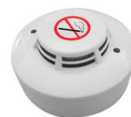
CDR-727 pro ústřednu EZS